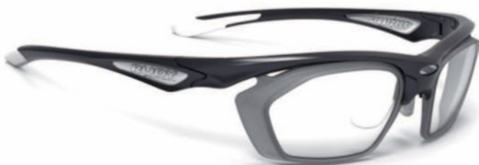
Rudy Project Stratofly Optical Dock

Rudy Project wurde 1985 in Treviso, Italien, gegründet und ist seit über 30 Jahren weltweit führend auf dem Gebiet der Sportbrillen. Alle Produkte von Rudy Project vereinen meisterhaft Spitzentechnologie und ästhetisch geformtes Design mit italienischem Styling und Liebe zum Detail. Rudy Project Sportbrillen sind mit Ihren persönlichen Glasstärken, mit hellen Gläsern oder auch als Sonnenbrille mit Blend- und UV-Schutz in vielen Varianten erhältlich.